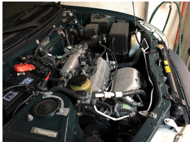
Dalla posizione che ne consente la massima visibilità.