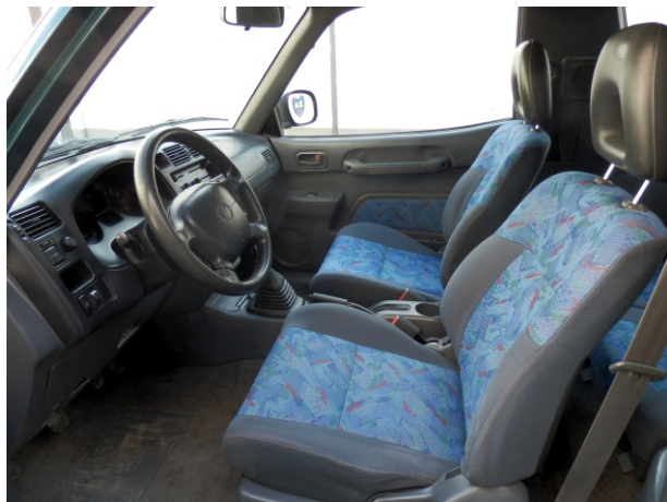
Visibili i sedili per intero, il cruscotto e il volante.