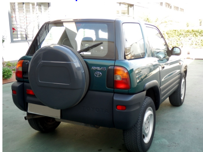
TARGA ben visibile