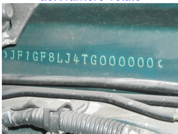
Foto ravvicinata e leggibile