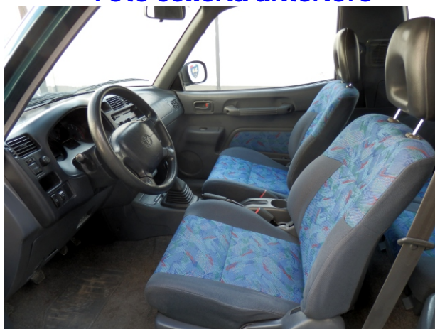
Visibili i sedili per intero, il cruscotto e il volante.