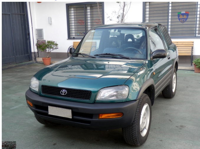
TARGA ben visibile