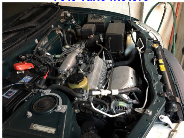
Dalla posizione che ne consente la massima visibilità.